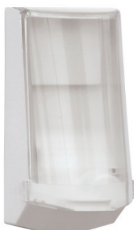
Art nr 4546 Automatdispenser