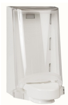
Art nr 4551

Exempel på dispenser till 700 ml systemet