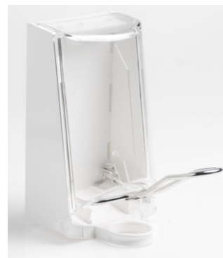
Art nr 4567