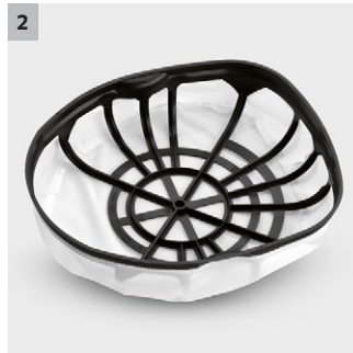
2 Permanent filterkorg