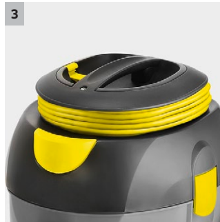
3 Sladdförvaring på maskinen