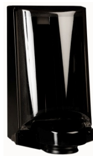
Svart Art nr 3552