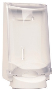
Vit Art nr 3551